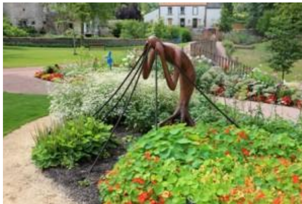
Les hommes médicinaux à Camifolia

Une dégustation d'infusions ponctuera la visite